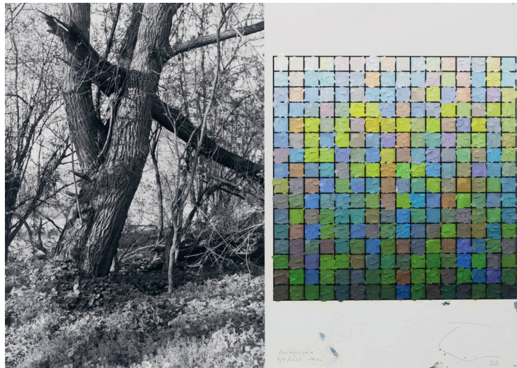
Stijn Cole «Bourgoyen 4 avril 17h30» de la série «Souvenir» Huile sur impression jet d'encre sur papier 29,7 x 42cm 2023