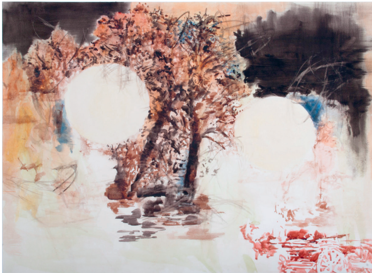
Uwe Wittwer «Landschaft nach Constable (Landscape after Constable)» Aquarelle sur papier 54 x 74cm 2017