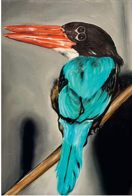
Léopold Rabus «Sans titre» Huile sur bois 23,5 x 15,7 x 2,8cm 2022