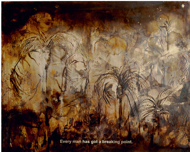
Sandrine Pelletier «The Breaking Point» Acide et platine sur laiton 100 x 80cm 2023