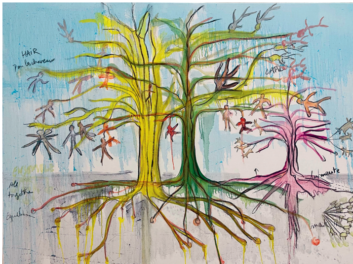
Fabrice Hyber «Les meutes» Huile et fusain sur toile 96 x 130cm 2023