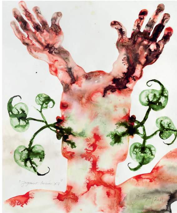
Barthélémy Togo «Judgement dernier XVI» Aquarelle sur paper marouflé sur toile 107 x 90cm, encadré : 112 x 94cm 2011